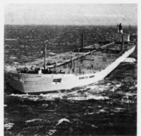
Oljuskipini sigla í føroyskum sjógvum

– Heimalfur havi eg við mer eina drúga frageið- ing um Braer vanlukkuna og havi myndugleikarnir læru av hest. Hendan frageiðing er 500 síður drúg og er skrivað av Lord Donaldson. Hon snýr seg serliga nógv um hvussu skipini kunna gerast trygg ari. Eitt nú við duplimum skrokki, tveimum motorum, tveimum skrumum o.s.v. Braer for just á land, tí hann