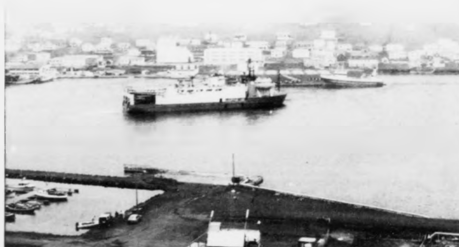
Vágbingar hava gjørt nógv tilfar til oljumeßuna í Aberdeen. Teir halda Vág vera væl egnada at taka imóti eini komandi avbjóðing frá oljuveginum.

Landsskrivstovan Tinganes Postboks 64 110 Tórshavn