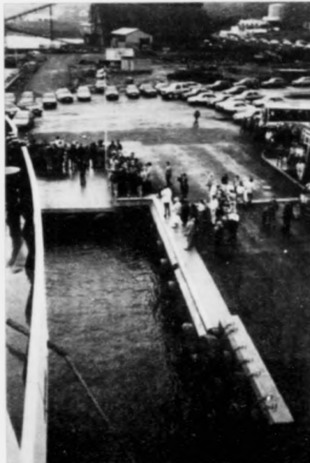
Tvøramenn halda, at Drelnes er væl egnað at hysa oljuveginum. Her ber eisini til at bygja út

beita í økinum sunnan fyri at bruka fasilitetir í Suðuroynni. Hann heldur at Vágur og Tvøroyri eiga at leggja eitt samstarv til rættis, soleiðis at báðar kommunurnar í felag kunnu ganga oljufelagunum mest á móti.