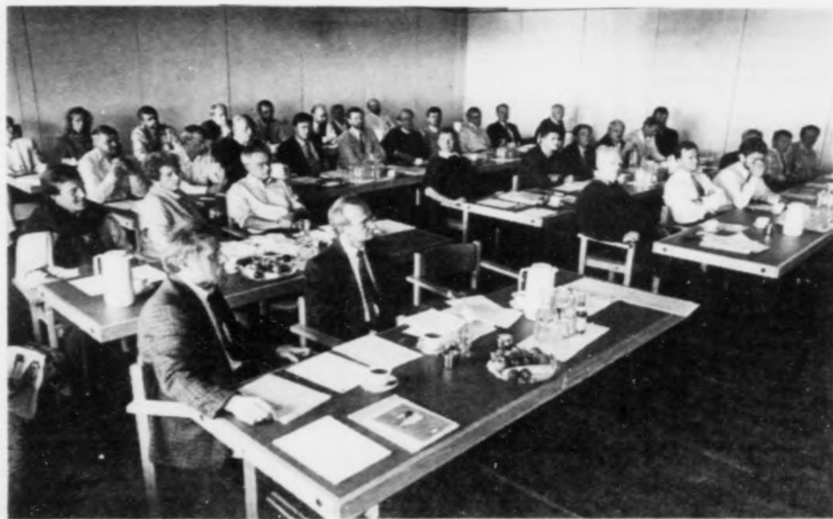
Umleið 30 fólk frá DONG halda skeið í á Hotel Føroyum í hesum døgum.