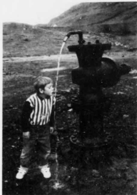
Enn er horikranin í Lopra spælláss hjá børnunum. Skjott verður hetta sama plássuð møguleiga ein tyðandi partur í leitingini eftir olju og gass. Mynd jan