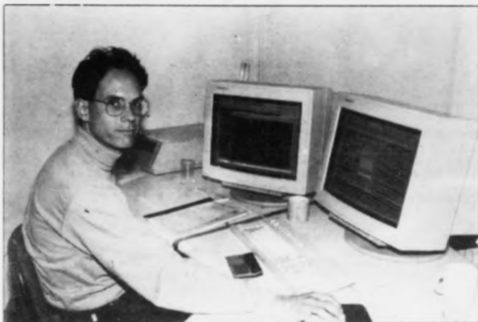
DOPAS hevur framkomna talingarútgørd til seismikk.