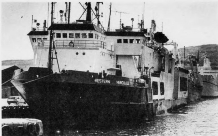
Tað líðir nú so væl við seismisku kanningunum við Føroyar, at annað av skipunum, Western Hercules, varð liðugt við sin part og legð kósina aftur til Onglands ella aðrar kanningarleiðir. Her skipið við bruggju, aðrenn tað fór í farnu viku.

Kent og virt skotskt ráðgevarafelag innan oljuvinnu: