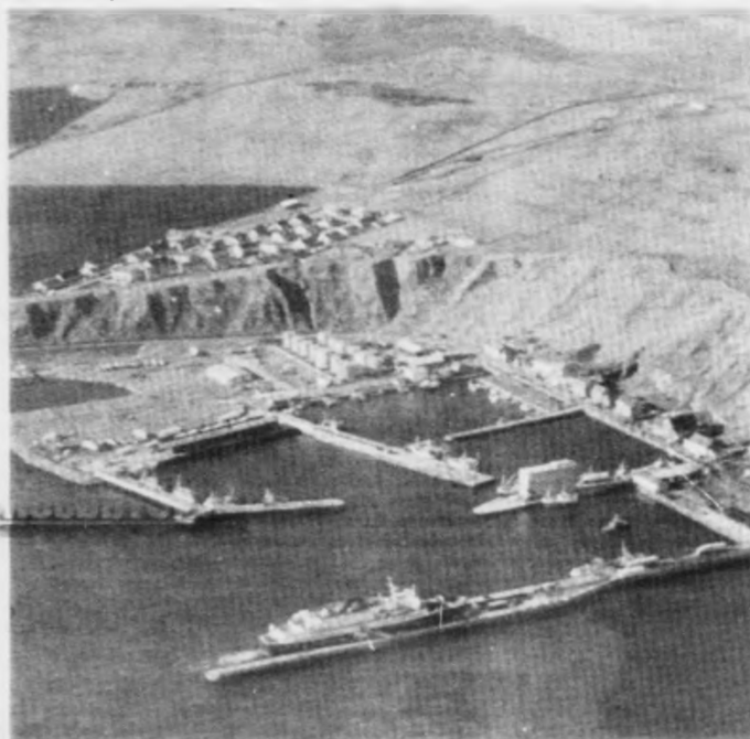
Havnin í Scrabster í dag. Nu skal hon úthyggjast fyrri 250 mill. kr. Caitnessbúgar hugva seg ut til at mæta avbjóðingina frá oljuvinnu vestan fyrri Hetland.

Eisini nógvar føroyskir fiskimenn hava tilknýti til Scrabster. Tannan leggja føroyski skip verðuna upp har, tí hetta er stvísti teinin úr Føroyum til út-