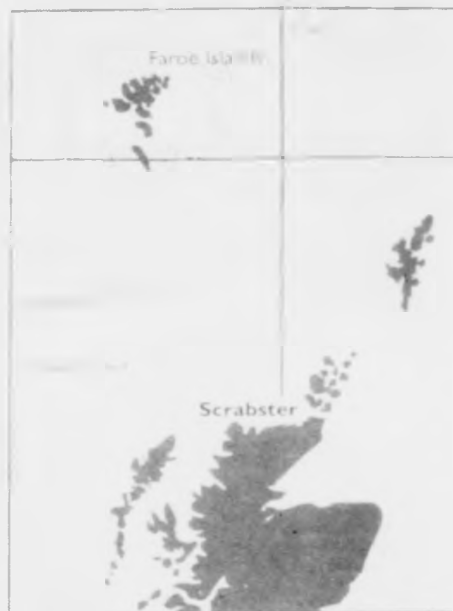
Sannlíkt er at oljuvinnan fer at arbeiða millum Skotland og Føroyar, og tí liggur ein útgerðarhavn í Scrabster sera væl fyrri eins og ein líkandi havn í Føroyum.