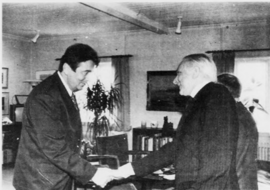
Avgjörður lögmaður um bretsku marknakrøvini: