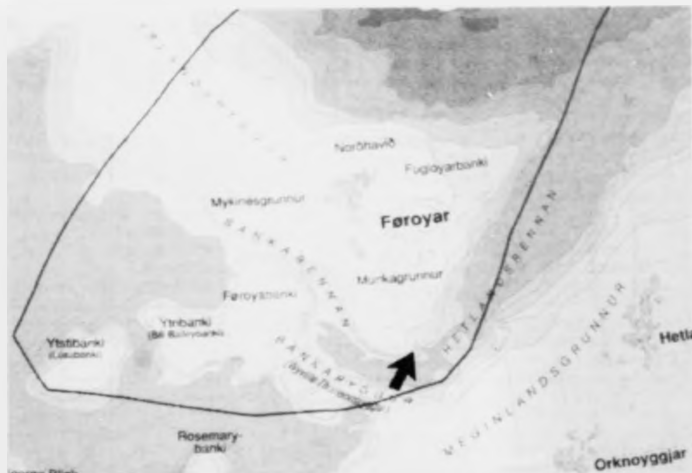
Pilurin visir okkum landssynningshornið á føroyska landgrunninum, sum bretar eru uti eftir men sum teir ikki fáa sambært lögmann, mynd jan