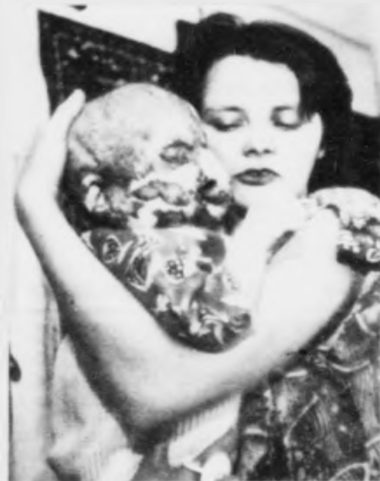
Fimten mánaðar gamla íra er eitt av teimum mongu børnunum í Ukraina, ið hevur fingið hjálp gjøgnum Skandinavisku Barnamiðsinnina