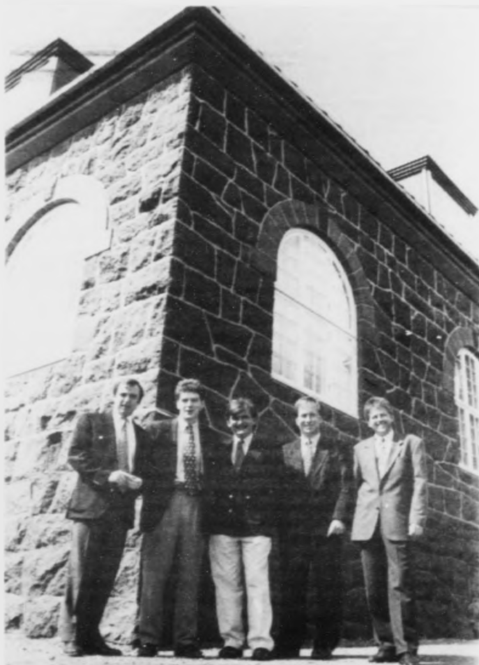
Teir fimm stjórnarir og serfrøðingarnir hjá BP eftir væleydnaðan fund við oljuráðleggingarnevndina, her utan fyri "nýggju" høluni hjá oljufyrirsitingini á Debesartøð.

Skotsk bláð hava fyrr skrivað, at BP her hevur