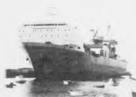
Petrojarl, sum varð bygdur sum hjálparskip hjá sovjettska milliterinum, verður nú longt á spanskari skipasmíðju og verður fyrsta framleiðandi skipanin vestan fyri Hetland.