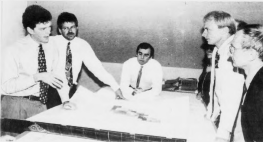
Serfræðingar hjá BP greiða oljuraðleggingarnevnd og oljufyrirspá frá niðryggja frá oljuleitingu vestan fyri Hetland.

gjort eitt stórt fund. Hetta vilja BP-fólkini, sum vitjað hava í Føroyum, hvorki valta ella avsanna.