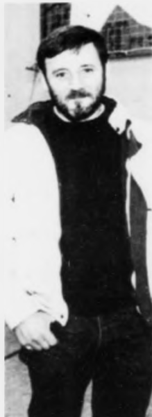
Altjóða hvalaveiðu fundurin verður settur í Dublin mánadagin. Men hesa vikuna er sokallad "workshop" um "human whale killing". Landsdjóra læknin umbodur Føroyar.

Tá umbodt fyrí Føroye Islands Solidarity Comm