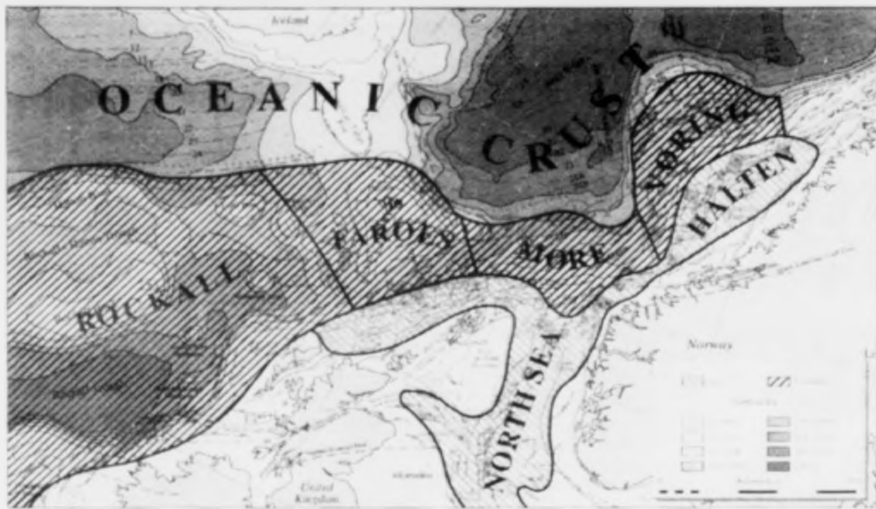
Vöring, Møre, Færoyar og Rockfall eru óki, sum oljufelögin nú seta sitt allt til

sera stór dýpi, heilt niður á 1500 til 2000 metrar. Tað er so aftur ein stór avbjóðing fyri oljufelögin, sum eru von á arbeiða á dýpum heilt niður undir 100 metrar.