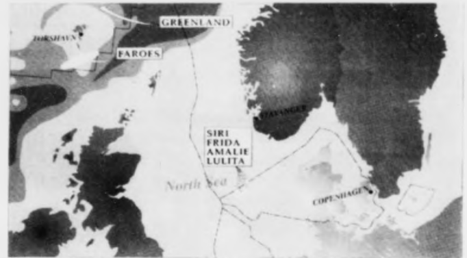
Statoil er sinnad at bruka pengar til leiting bæði á donskum, føroyskum og grønlandskum øki

Tað er sjálvandi ikki rætt at siga, at tað nú gongur