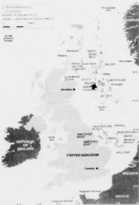
Pilurin vísir, har Nelson oljupallurin er