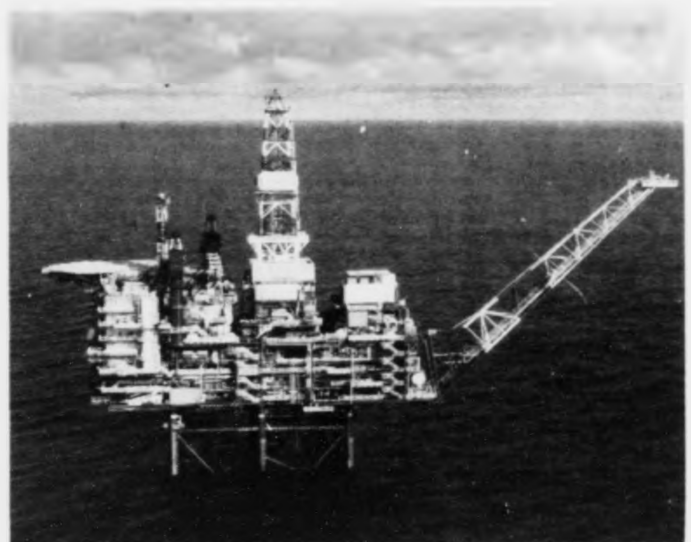
Nelson oljupallurin miðskeiðis í Norðsjónum.

Vit fara her og í komandi bløðum at triva í eitthvørt frá hesi ferð, sum vit halda hevur áhuga fyrri bæði føroyska almenningin men eisini fyrri tey fólk, sum í dag og í framtíðini hava og skulu hava okkurt tilknýti til føroyska oljuvinnu tað verið seg politikarar, oljumyndugleikar, vinnulivsfólk, útbúgvingarstovnar osfr. jan