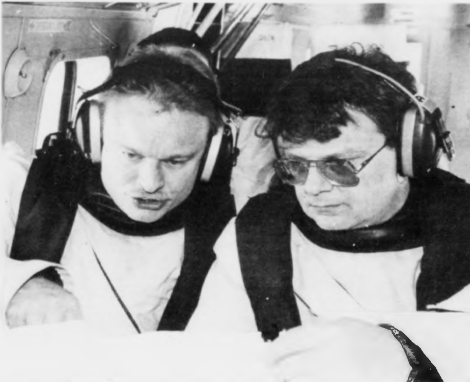
Læðin gongur heim aftur til Aberdeen av Nelson oljupallinum. Sjónvarpsmaðurin og útsvarpsmaðurin seta út í kortið.