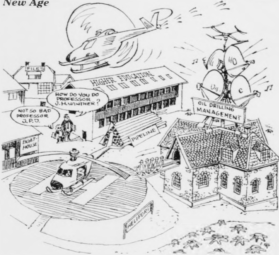
Í dag flýtur Oljufyrirveitingin inn á Debesartred