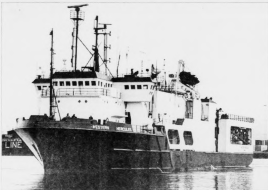
Western Hercules fyrri fyrstu ferð á Havnini. Tað ger nú seismiskar upptøkur á Føroyaleiðini. Mynd kalmar

eisini hava valt at fylgja Hann sigur, at bæði fyrirsiting og ráðleggingarnevnd ætla sær at gera alt fyrri at halda hesa tíðarættan.