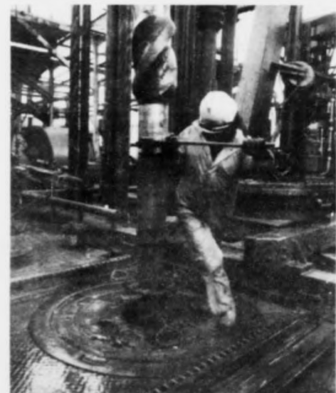
Oljuarbeiðsmenn her við at bora eftir olju vestan fyri Hetland.

Wood Group segði í hóskaðum at felagið hevði sent havnastyrinum skriv, har sagt var frá, at felagið hevði áhuga í hvat fer at henda í Scrabster. Sum altíð taka feløg í oljuvinnuni ikki munin av fullanog máli aðrnevndi tals-