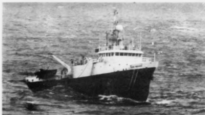
Hesin supplybáturin er til arbeiðis stutt frá føroyska markinum.

tænastruveitingar til oljuvinnuna vesi so stóra áhuga, hóast atlanir hjá havnastyrinum enn bert finnast á pappirinum. Hetta, sigur harra Sampson, vísir at feløg gjølla fylgja við í hvat fyrilestir í Scrabster.