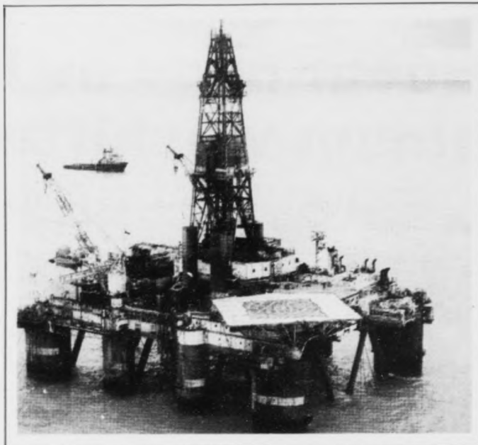
Boripallurin Dyvi Stena, sum onga olju fann, har roknað varð við at finna olju. Hóast einki spurdist burtur úr hesaferð, so eru vónirnar framvegis tilstaðar

BP fann Schiehallion-økið í 1993, men Amerada Hess kom framá hvat skuldi visa seg at vera ein leinging av økinum í fjør. Tann 7. fe-