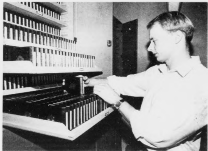
Heri visir okkum nakrar av diskettunum við eldri seismiskum kanningartilfar undan Føroyum. Nú kemur so nýggjasta tilfarið klárt til at tulka.