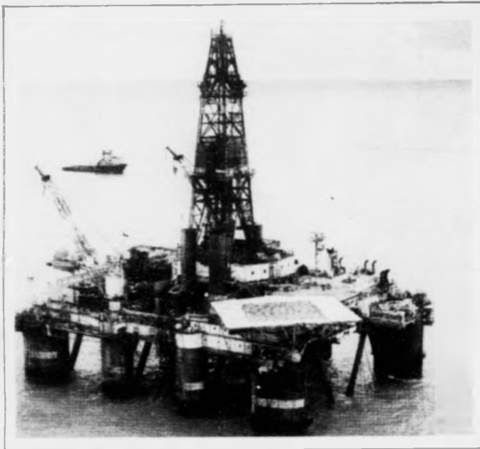
Boripallurin Dývi Stena sum just er byrjaður at bora ein nýggjan brunn í Schiehallion-økinum

Amerada Hess og BP samstarva nú við tí endamáli sum skjótast at meta um vinnuligu møguleikarnar í Schiehallion-økinum