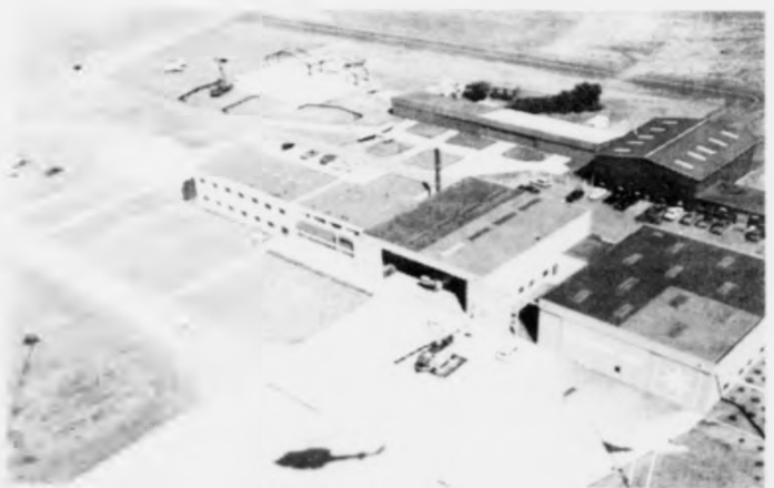
Mærsk hevur drúgvur royndir í tyrluflúgving og tærnastu í sambandi við oljuvinnuna í Nordoyggjum. Her síggjar vit helikoptarabasan hjá Mærsk í Esbjerg.

ut til at kunna tæna oljuvirkseminum ella tað er skilabest at brúka verandi vøll og fælitteir í Vágum. Tað er alt ov tíðliga at siga nakad um tað ein, men vit fara so fyrsta dagin at koma við einum uppskoti til landsstýrið um, hvussu