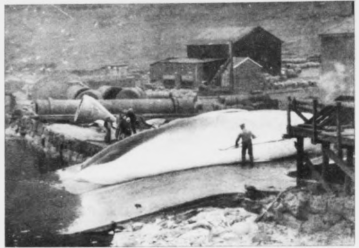
Tað var tann tíð, at tað stóð ikki á at veiða stórhval við Føroyar

Flokkurin heldur, at fara vit undir royndarveiðu, eiga vit ikki gera sum íslendingar, at veiða og nóg. Tiltakið bæði er, og sær truligt út, um vit bert skjóta nakrar fáar hvalir, og onnur fáa ta fatan, at skjót-