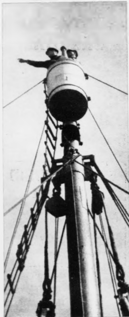
Stórhvalur í veisjón

Tá lögmaður skal tingast við Douglas Hurd: