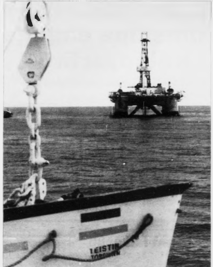
So stutt frá siglingarleiðini hjá Teistanum er oljukeldan Foinaven, har bretar um ár fara undir fyrstu framleiðsluna nakrantíð vestan fyri Heiland.