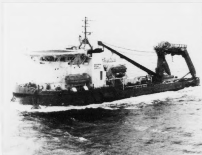
Hetta serútgjörða skipið, Northern Explorer fer í summum at seta eina framleiðslu- verkumdu á havbotnin skami frá føroyska fisksmákinum.

-Vit ætla okkum ikki út í nakað, sum vit ikki klára tøkniliga - vit byggja á fortíðina og royna at koma nakað víðari sigur hann.