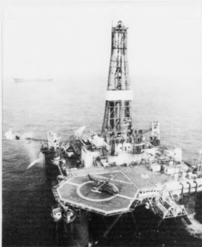
Oljupallurin Ocean Valiant og tungaskipið Vigdis Knudsen stóðu fyri fyrstu framleiðsluroyndunum frá Foinaven kelduni í fjør.

Nú tað er farið út á stóru djúpini í Atlantshavi eftir olju setur tað eisini heilt nýggj krøv til oljuídnaðin. Og tað eru hesar avbjóðingar, sum bretska oljuídnaðurin nú roynir at liva upp til. Tí er verkætlanin hjá BP eitt pionerarbeði, eitt slag