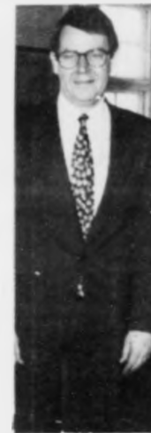
Poul Nyrup Rasmussen