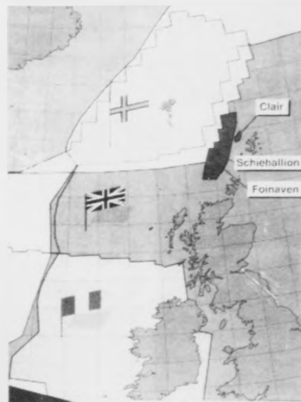
Kortid visir okkum parti av krøvunum hjá føroyingum, bretum og irum til umstríddu økini