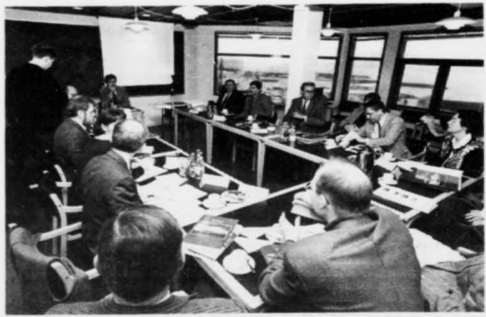
Umboð fyri trý oljufeløg á fundi við Oljufyrirsitingarnevndina í gjár.