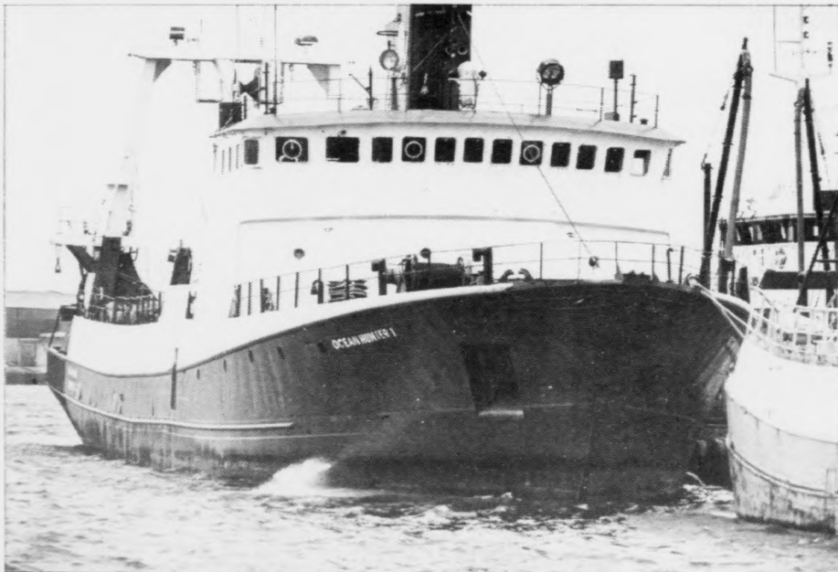
Føroyingar stovnað amerikanskt felag

Føroya Landsstýri Postboks 64 110 Tórshavn