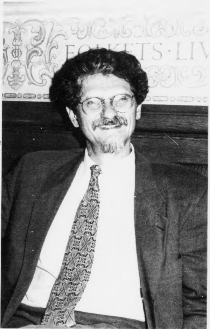
Mogens Lykketoft, figgjarmálaráðharri: – Danski stuðulin til Føroyar er tengdur at spurningunum, um fiskivinnan fær fótáð sær aftur og um olja er í undirgrundini.

– Vit stuðla Føroyum uttan mun til, um føroyingar vilja søkja um limaskap í ES, ella um tað bert er talan um frihandilsavtalu. Viðvíkjandi marknaðar- og gongd, so er nógv, sum bendir á, at tað er ein fyrimunur hjá Føroyum at gerast limur í ES, men tað muðu føroyingar sjálvir gera av, sigur Mogens