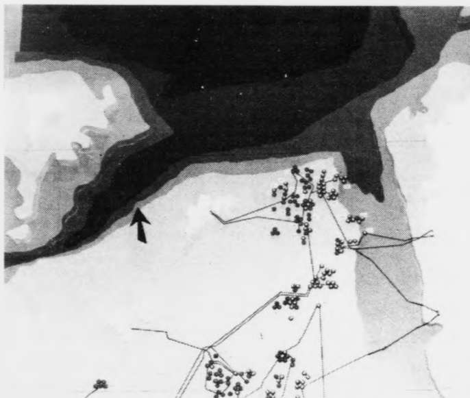
Vit siggja tey mongu støðini í Norðsjónum, har olja verður framleidd. Pílurin vísir okkum, hvar fyrsta framleiðslan millum Føroyar og Hetland fer í gongd um eitt ár. Oljufeløgini mugu til at gera nýggja oljukort

Ein frágreiðing, sum júst er almennakunngjørd sigur, at oljuprisurin aftur fer at hækka munandi, og tað verður um ikki so langa tíð. Hetta fer so aftur at økja um vinningin frá oljukeldunum vestan fyri Hetland.