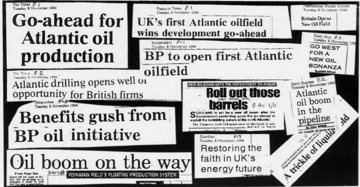
Öll blaðini í Stórabretlandi gera nógv burtur úr tíðindunum at það nú er givið loyvi til oljuframleiðslu úr Foinaven kelduni. Her nakrar av yvirskrifunum