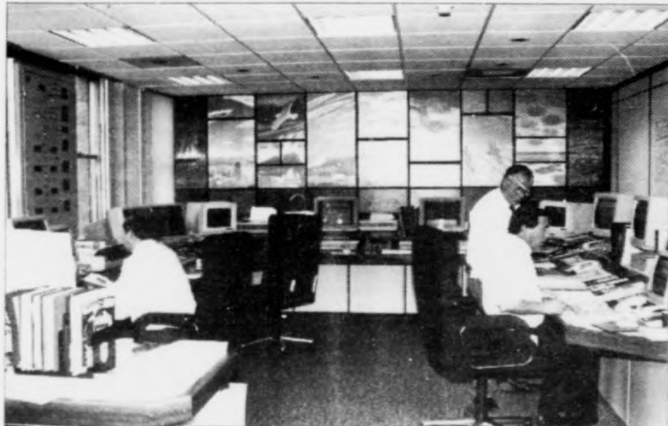
Her á hævudsstöðini hjá BP (Aberdeen streyma) mull tunnur av olju úr Norðsjónum inn gjørgnum teldurnar hvønn dag