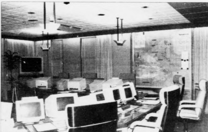
Bjargingarrúmið, har samband er við allar 15 boripallarnar hjá BP. Higan verðar alt hjálparbeiði stýrt, um onkur vanlukka skulda heni