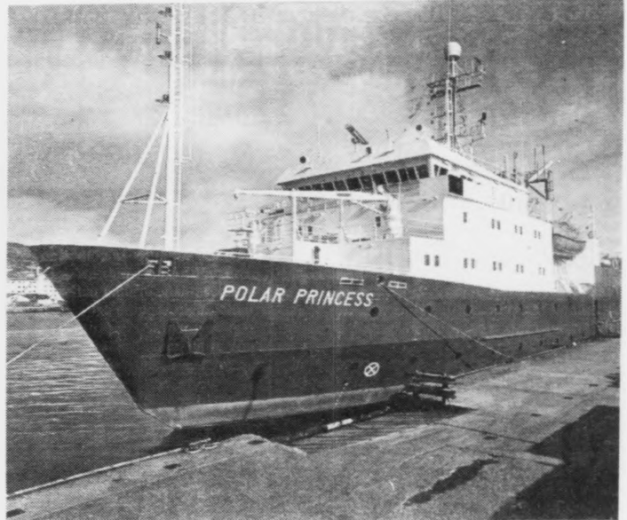
Polar Princess, sum hevur loyst Sea Star av og nú ger kanningar undir Føroyum.

siga nakað um møguleikar at finna olju og gass. Fyrst skulu seismisku upplýsingarnar víðgerast í London.