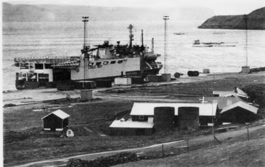
Sea Star við bryggju á Sundi.

Fyri tey mongu, sum koyra framvið Sundsbygd og stóru og óbrúktu havnalagnum har man tankin um eina komandi oljuvinnu har ikki vera so fjarur. Nú amerikanska seismikkskipið "Sea Star" hevir fingið avloysara og riggar av, hevir felagið valt at lata skipið liggja við bryggjuna á Sundi í eina góða viku.