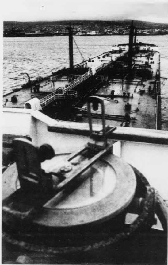
Her liggur risaoljuskipið Stratos á Havnini, slik sjón verður ikki óvanlig um nokur heilt fá ár sleppa oljufeløg framat. M. Kalmar