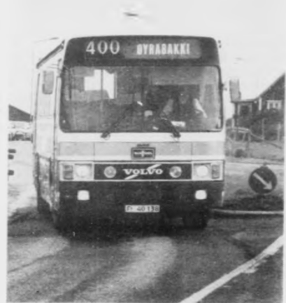
Fullt forsvarlig koyring, sigur bussførarin. Savnsmynd: Kalmar

Ikki sluppu øll við Leirvíks-bussinum av Farstøðini um hálvgrunnfimm tíðina týskvöldið, tí so mong høvdu teknað seg til túrin í samband við fótbóltsdystin á Svangaskarði.