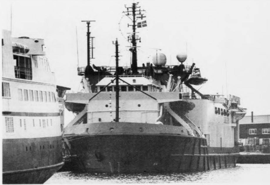
Seismikkskipið undir Føroyum: