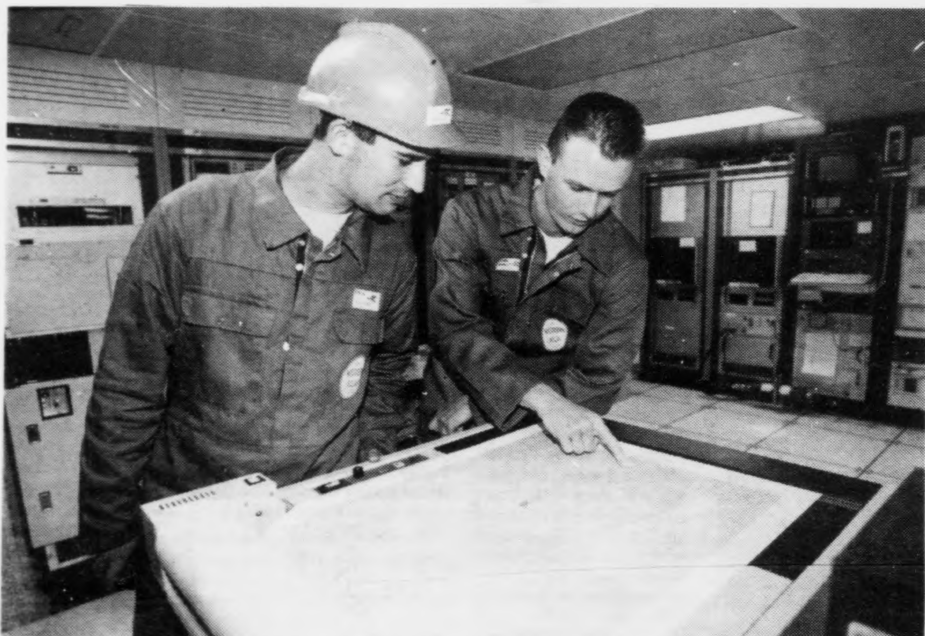
Teir gjørdu eina "testlinju" sunnanfyri fyrri at royna útgerðina.

Nøgt bendir á, at olja finst í føroysku undirgrundini. Hetta var greiða svarið vit fingu frá Western-fólki umborð á seismikkskipinum Sea Star friggjadagin. Bretsku fundini beint við føroyska markað og seismiskar og magnetiskar kanningar, sum eru gjørdar á føroyska økinum benda á, at tað uttan iva finnast stórar oljugoymslur á føroyskum øki. Spurningun er bara júst hvar