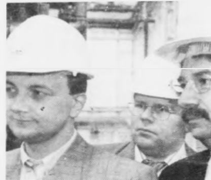
Føroya Oljuindvagnar var vælumboðaður umborð á Sea Star.

-Vitjan tykkara í dag og arbeiði tykkara komandi mánaðirnar kann gerast eitt sera týðandi vegamót í føroyskum vinnulívi og fyri alla føroysku tjóðina sum heild. Tit skulu vera hjartaliga vælkomnar higar og vónandi kunnu vit fáa eitt gott sam-arbeiði.