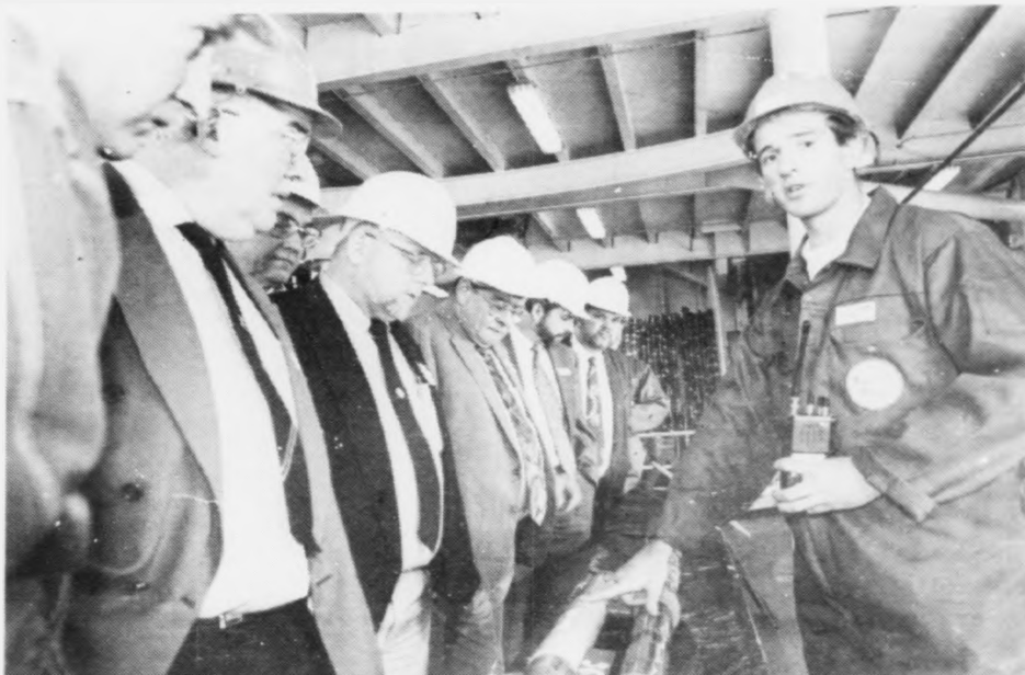
Fyrirkomandi og fryntlig var manningin umborð á Sea Star, tá føroyingar vitjaðu umborð.