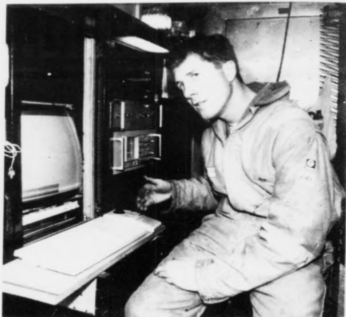
Nógv útgørd er komin úr Skotlandi og verður nú sett upp í Lopra.

enn at hetta er veruliga byrjanin til eina møguliga komandi føroyska oljuvinnu. Enn vita vit ikki, um olja er í undirgrundini, men seismisku kanningarnar skulu geva okkum ábendingar antin olja og gass kann vera í føroysku undirgrundini ella ikki. Ikki fyrr enn veruligar