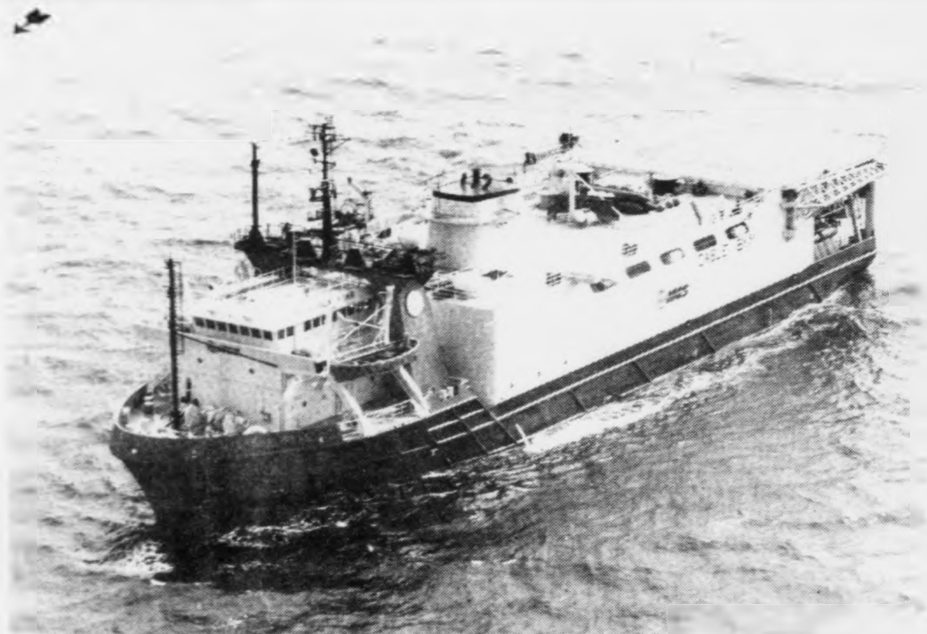
Amerikanska seismikkskipið "Sea Star" kom í foroyiskan sjógv mánadagin og fer longu í dag at skjóta fyrstu seismisku linjurnar. Tað kemur á Havnina hóskvöldið og fer á Lopransfjør friggjakkvöldið at gera kanningar har

sjógv. Ætlanin var at skjóta nakað av seismikki longu mánadagin, men orsakað av vánaligum veðri hefur verið biðað til í dag.