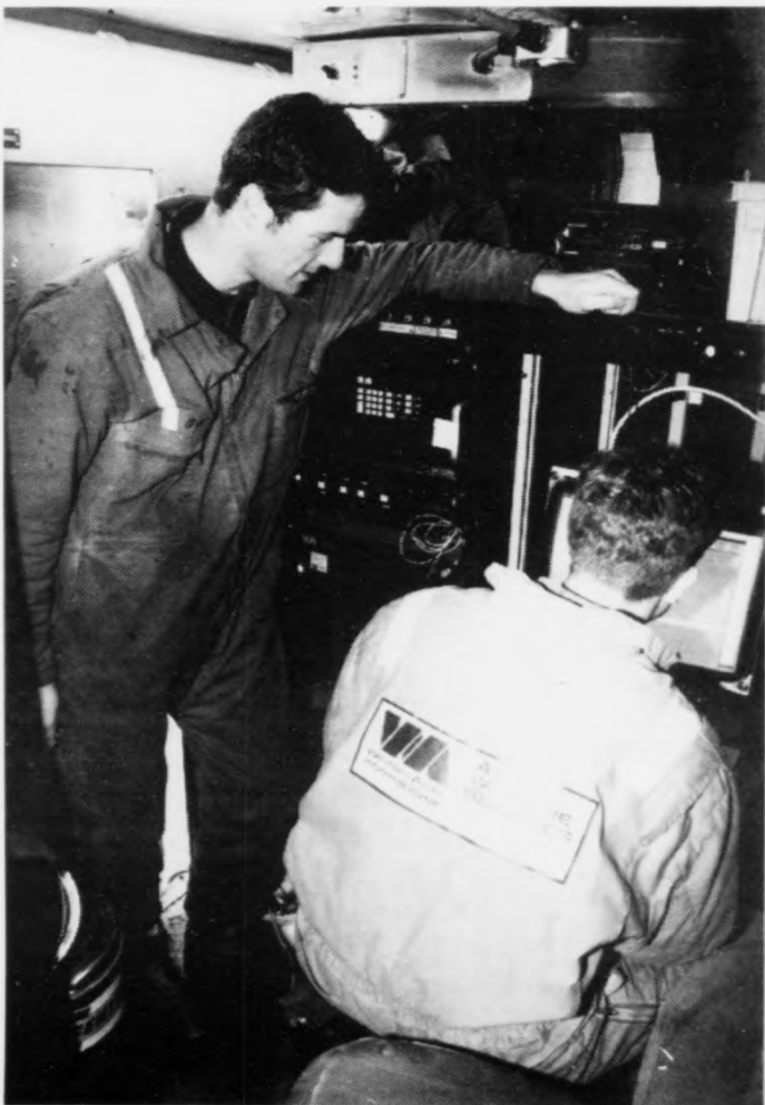
Teir eru við at rigga til tær fyrstu seismisku kanningarnar í Lopra.

Um somu tíð sum teir eru við at fyrircika seg til fyrstu kanningarnar í Lopra, so er seismiska skipið hjá Western, Sea Star komið í føroyskan