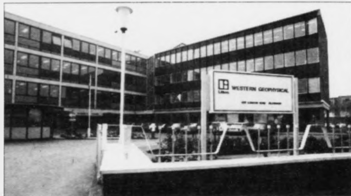
Føroyingar vitjaðu eisini á høvuðsskrivstovuni hjá Western í London