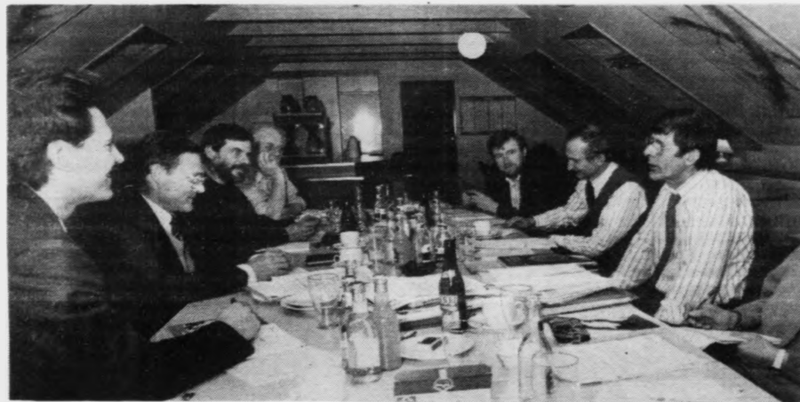
Hesi kunnu vera fegin. Føroyska oljuráðleggingarnevndin, sum hevur lagt eitt ómetaliga stórt og kvalifiserað arbeiði í allan oljuspurningin, kann nú fegnast um, at annað stóra stiggið er rokkið. Tað fyrsta var frágreiðingin til landsstýrið. Nú fer nevndin at arbeiða víðari við lóggávu og øðrum í samband við veruliga oljuboring

Landsstýrið hevur vónir um, at hesar kanningar fara at fáa til vega eitt haldgott grundarlag fyri olju-feløgini at fara undir veruligar oljuleitingar við Føroyar.