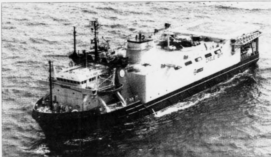
Tað verður helst hetta skipið, Sea Star, sum kemur at gera kanningar í føroyskum sjógví í ár. Skipið er sera væl útgjort og hoyrir til Halliburton-flotan, sum Western herfyri yvirtók.