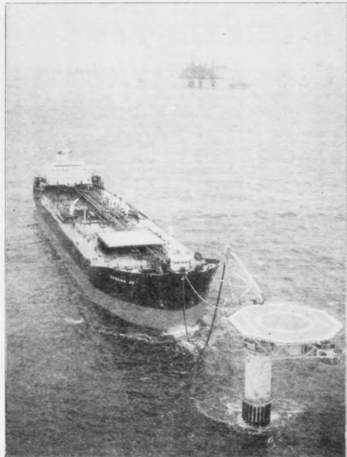
Um tvey ár verður hetta vanlig sjón stutt úr Føroyum