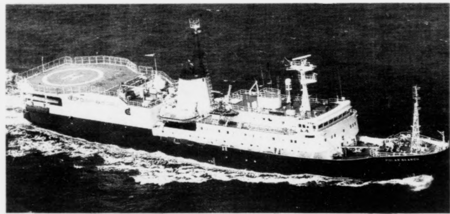
Tað verða skip av hesum slagnum, sum um ikki so langa tíð fara at gera seismiskar kanningar við Føroyar. Hetta skipið eigur amerikanska felagið Digicon. Umboð fyri felagið hava verið í Føroyum greitt frá felagnum. Sleppa teir upp í part verður tað heita skipið, sum fer at gera seismisku kanningar. Digicon eigur eisini Arcadian Searcher, sum herfyri gjørdi kanningar nærhendis føroyska marki num.