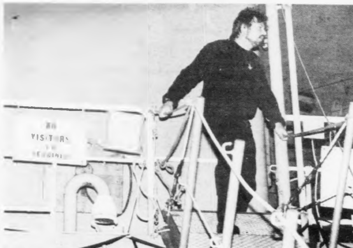
Tíðindablaðið Sosalurin ætlaði sær umboð á amerikansku skipið fyri m.a. at vita, um teir gera seismiskar kanningar, men skiparin vildi ikki loyva pressufólks umboð og ei heldur úttala seg um, hvat skipið gjørdi. -Eg havi forboðt fyri at siga nakað, og geri eg tað kortini, so missi eg arbeiðið segði hann, tá tíðindamaður og myndamaðurin Sossalsins vórðu "rikur" í land aftur. Mynd kalmar

hava fingið at vita, at tað er Mærsk í Keypmannahavn, sum er umboðt fyri skipið. Umboðsmaðurin hjá Mærsk í Føroyum sigur seg einki vita um hetta skipið annað enn at tað er eitt rannsóknarskip og ger uppgávur fyri bæði milliterið og privatar fyrítøkur. Tað skal entast at gera oceanografiskar kanningar. Á Fiskirannsóknarstovuni siga teir seg einki kenna til skipið.