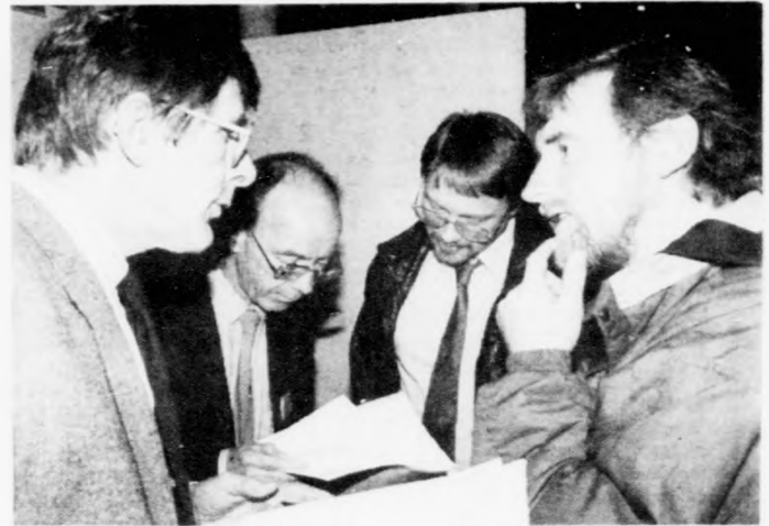
Í frá fundinum í Norðurlandahústinum ís- dagin. Eftir innleggini hjá brettum kunda føroyingar tosa við teir um komandi samvinnu.

D'Ancona vónar, at tað ber til at knýta samarbeiðsbond millum bretska og føroyska idnaðin og leggur hann serstakan dent á móguleikarnar hjá brettum at læra upp føroyingar í hesi nýggju vinnuni.