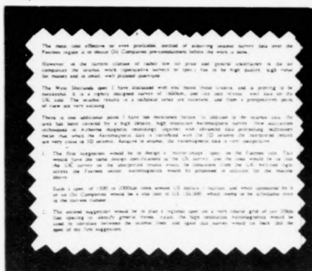
Partur av brævninum frá eini bretska ráðgevarafyrstøku sum svar upp á ein firsparning frá kunda.