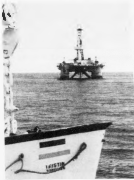
"Ocean Valiant", sum nú verður togaður úr Norðsjónum til føroyska markit er eins nógv framkominn og "Ocean Alliance", sum í fjør gjørdi eitt sensationalt fund í einum heilt nýggjum øki bert 9 fjørðingar frá føroyska markinum.

BP er annars í ferð við at gera framkomnar seismiskar kanningar í hesum