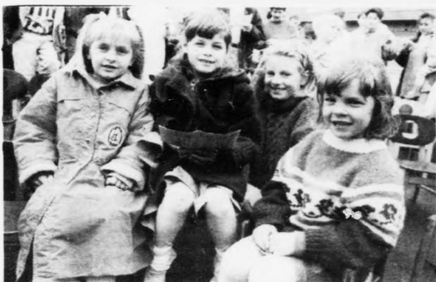
Barnagarðurin við Velhastavegin 20 ár. Síða 4