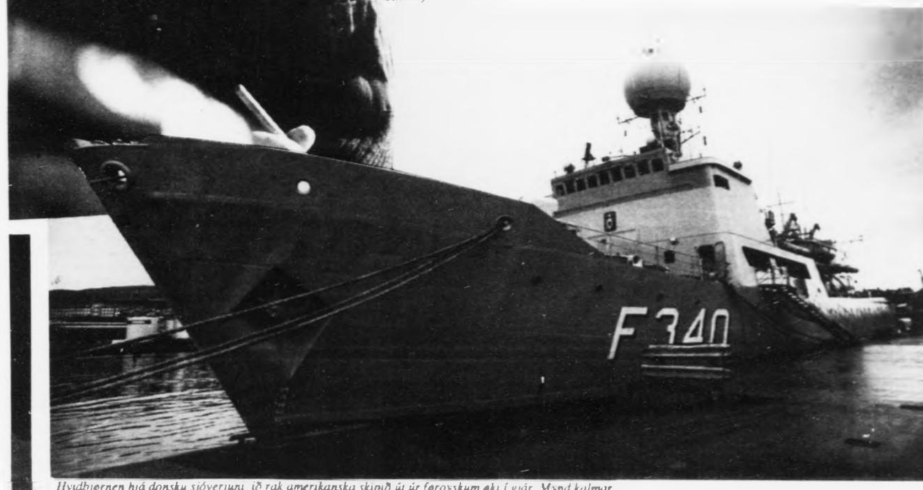
Hvidbjørnen hjá dansku sjóverjunum, ið rak amerikanska skipið út úr føroyskum øki í gjár. Mynd kalmur