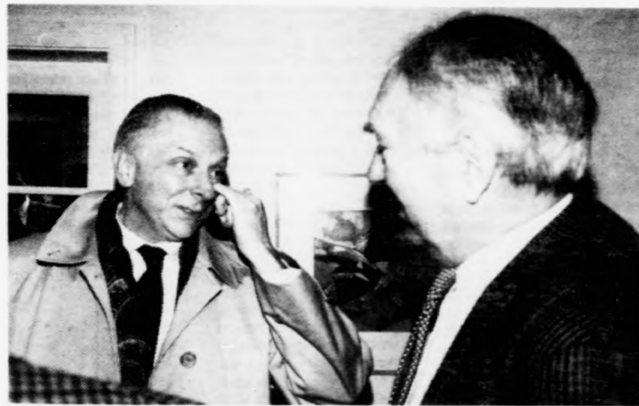
Bretski samráðingurleiðarin viðgekk fyrri Sosialinum, tá fundur var í Havn seinast, at nýggju marknaðkrøv breta hava samband við, at olja er funnin nær við miðlinjuna.