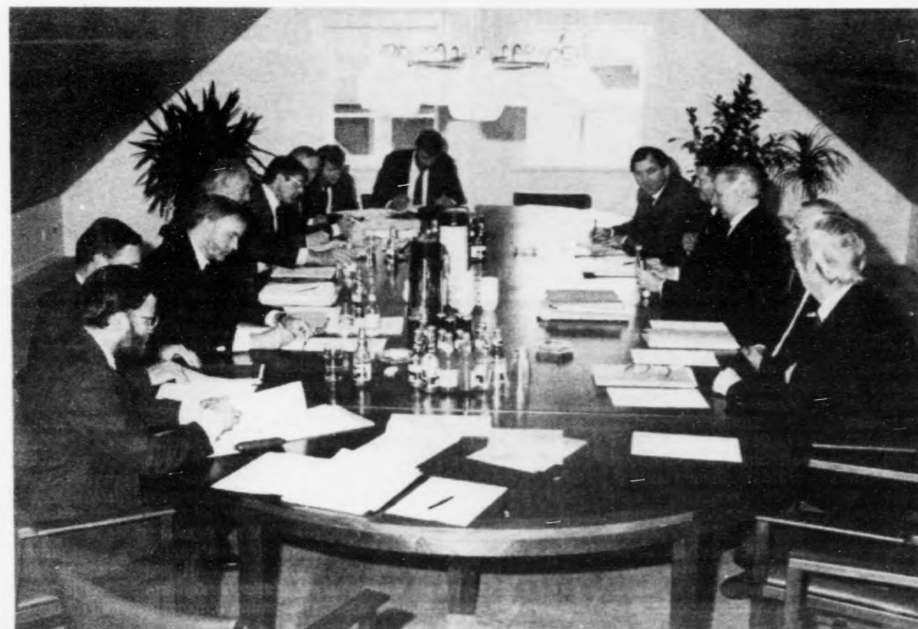
Teir bretar og føroyingar og danir møttust í Havn í fjør.