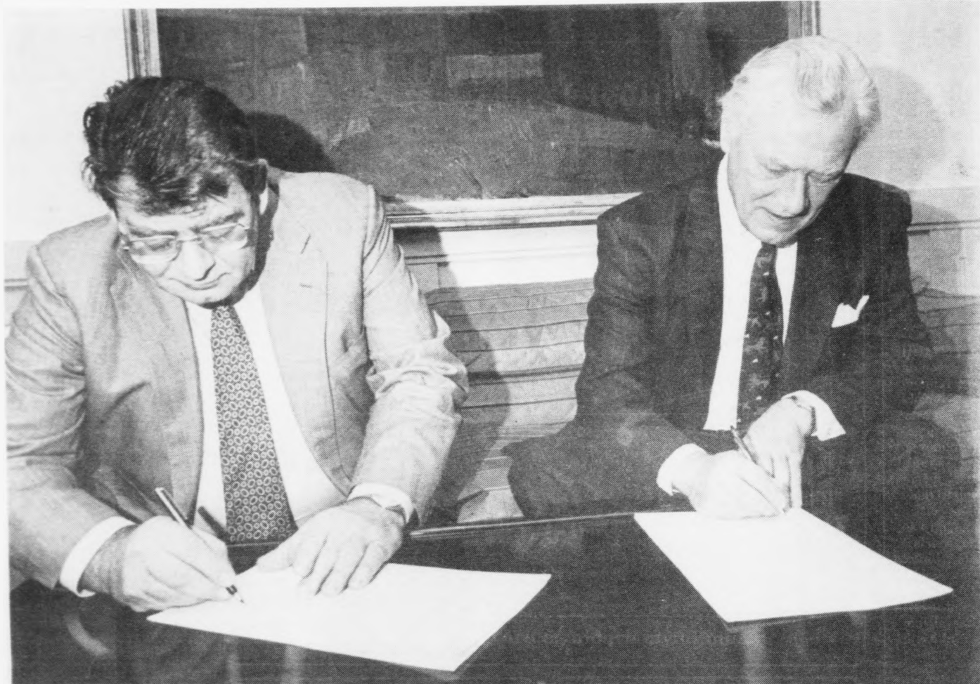
Poul Schluter, forsætisráðharri: