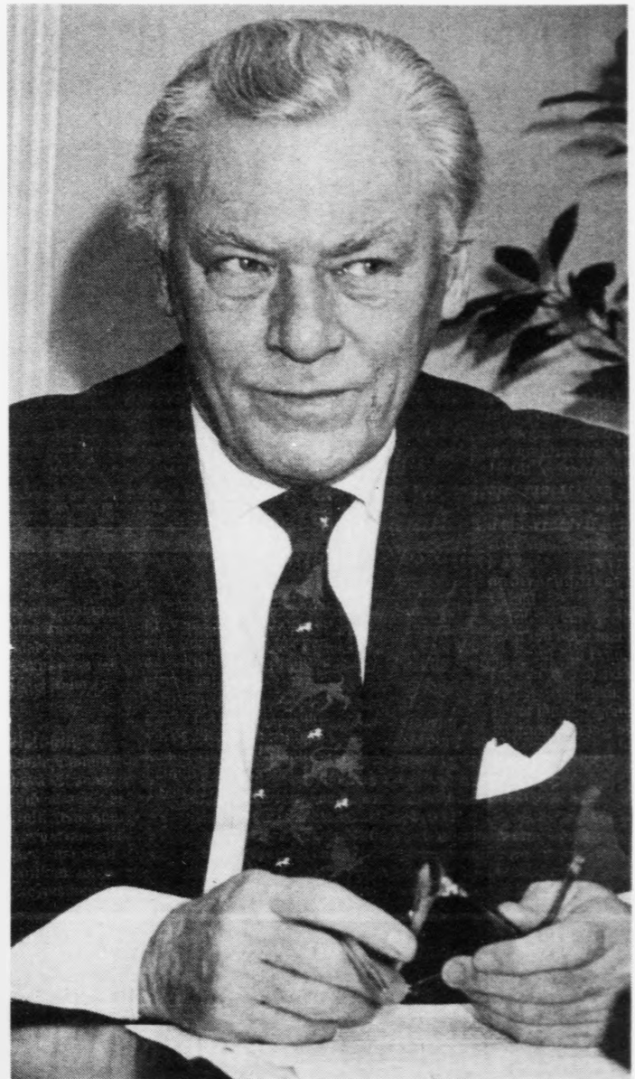
Poul Schluter, forsætisráðharri: