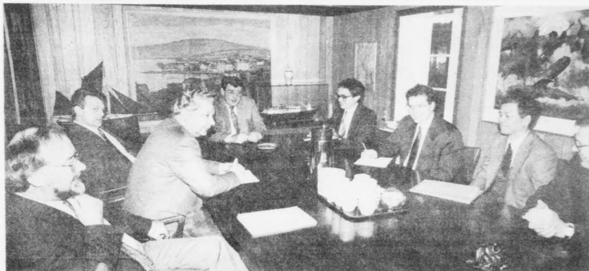
Orð jan Myndir kalmar

Teir triggir IMF-ararnir á fundi í Tingnesi saman við lögmanni og landsstýrismonnum