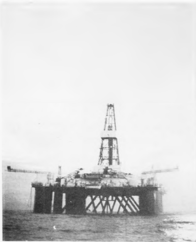
Oljupallur av hesum slag verður brúktur í boringini