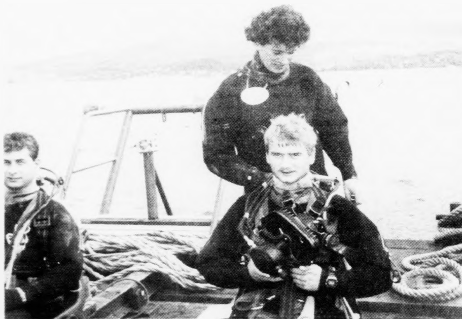
Høgni í ferð við at gera seg klára at kava utanfyri Fort William

-Vit hava stórt arbeiðsloysi í Føroyum, og tað er eisini torført hjá