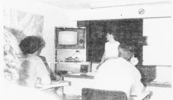
Høgni luttekur í undirvísingini saman við ungdómi úr fleiri londum

varar í 10 vikur. Tá kann hann arbeiða innan offshore-oljuvinnu kring allan heim.