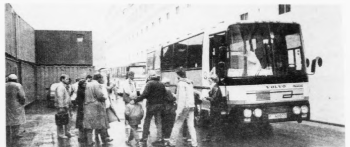
Landsstýrið vonar, at ferðamannastreyrnur kemur til skipað vidurskipti

aðrir vinnugreinar, átøkir teimum, vit vita um úr Singapore, Hong Kong, Malta, Gibraltar og øðrum londum, kunnu gerast Føroyum tøkir, upplýsti Athi Dam, lögmaður í ólavsókrøðu síni. Hann segði, at hesar kanningar eru komnar stutt ávegis, so niðurstaða er eingin.