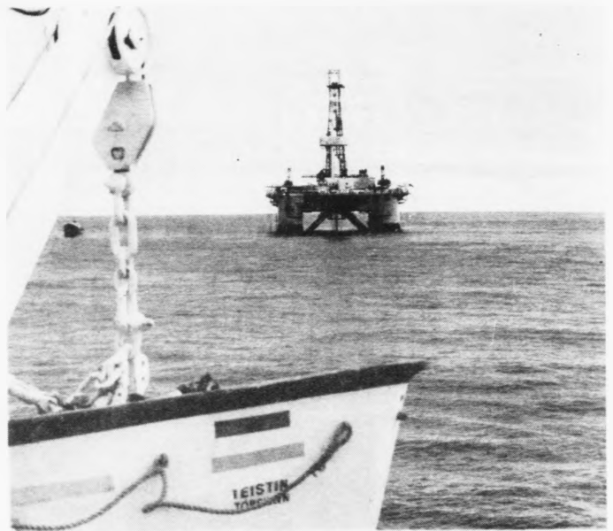
Landsstýrið er sinnað at stuðla fólki, ið vil bugva seg út í oljuvinnuni

Landsstýrið hefur skotið upp, at ávis peningaupphædd verður nýtt at stuðla fólki, ið vil bugva seg út til